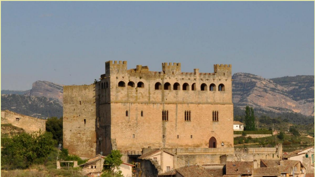
Castillo de Valderrobres

El municipio de Valderrobres se encuentra enmarcado dentro de la provincia de Teruel y en la Comarca de Matarraña. Situado en la zona noreste de la provincia, viven en él alrededor de 2.200 habitantes en una superficie de 124 kilómetros cuadrados. A 508 metros de altitud, Valderrobres es una muestra viviente de la historia medieval con un amplio castillo presidiendo su antiguo núcleo urbano desde lo alto del lugar. Valderrobrense es el gentilicio empleado para designar a los pobladores del municipio que ocupa un lugar estratégico en la Comarca del Matarraña y es cruzado por el río del mismo nombre.