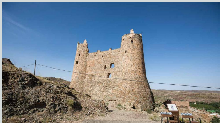
Castillo de Jarque de Moncayo

En el año 1273, se inicia la transición del régimen de tenencia hacia la de señorío, cuando Jaime I concede la villa y castillo de Jarque a Ferricio de Lizana. En el año 1285 Guillén de Alcalá, señor de Jarque, reclama la villa de Aranda, y en 1827 el monarca ordena la restitución del castillo y su población a Pedro de Alcalá, señor de Ayerbe. En el año 1290 el rey asigna la villa a Juan Ximénez de Urrea por nueve caballerías, permaneciendo bajo realengo mediante honores. En el año 1384, Pedro IV enajena por 52.000 florines de oro, como consecuencia de la ejecución de una sentencia arbitral dirimida sobre el castillo y villa de Borja, a Toda Pérez de Luna, cónyuge de Ximénez de Urrea. Jarque a través de los Alcalá engrosaría el patrimonio hereditario de los Fernández de Luna. Con todo ello, se afianza un modelo típico de señorialización, consolidándose a los Fernández de Luna en Jarque y a los Ximénez de Urrea en Aranda.