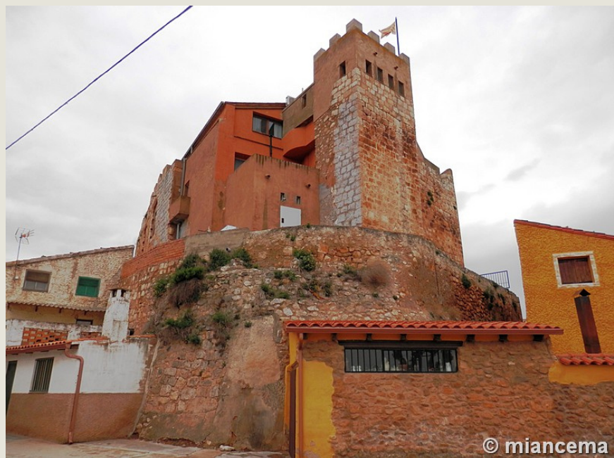
Castillo de Grisel

Al sur de Grisel se halla el monte de La Diezma, con un fantástico mirador desde el que se pueden observar unas espectaculares vistas de toda la comarca y, en especial, del Monte del Moncayo. En diversos puntos del monte existen unas singulares construcciones: Las Casillas de Pico, construcciones en piedra seca de gran valor patrimonial. Recientemente se ha restaura una de ellas, que es accesible desde el mirador de La Diezma.