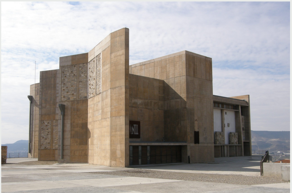
Castillo de Fraga

Las Guerras Carlistas dejaron su impronta en la Iglesia de San Miguel, conocida popularmente como “Castell” por haber sido caserna militar durante el conflicto.